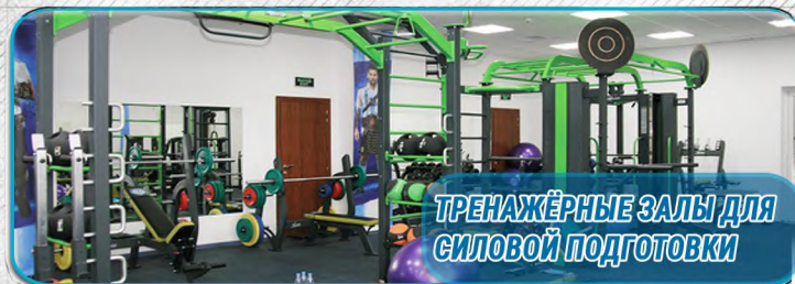
ТРЕНАЖЁРНЫЕ ЗАЛЫ ДЛЯ СИЛОВОЙ ПОДГОТОВКИ