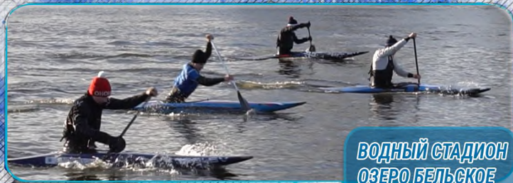
ВОДНЫЙ СТАДИОН ОЗЕРО БЕЛЬСКОЕ